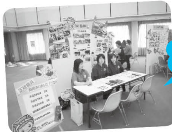
就職・転職 説明会