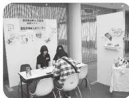
ハローワーク / 福祉人材センター / 保育士・保育所支援センター