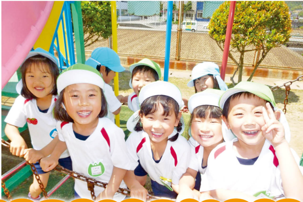
新居浜八雲保育園（新居浜市）